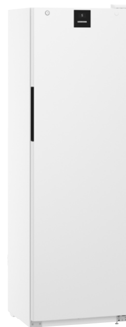
MRFVD 4001 WX